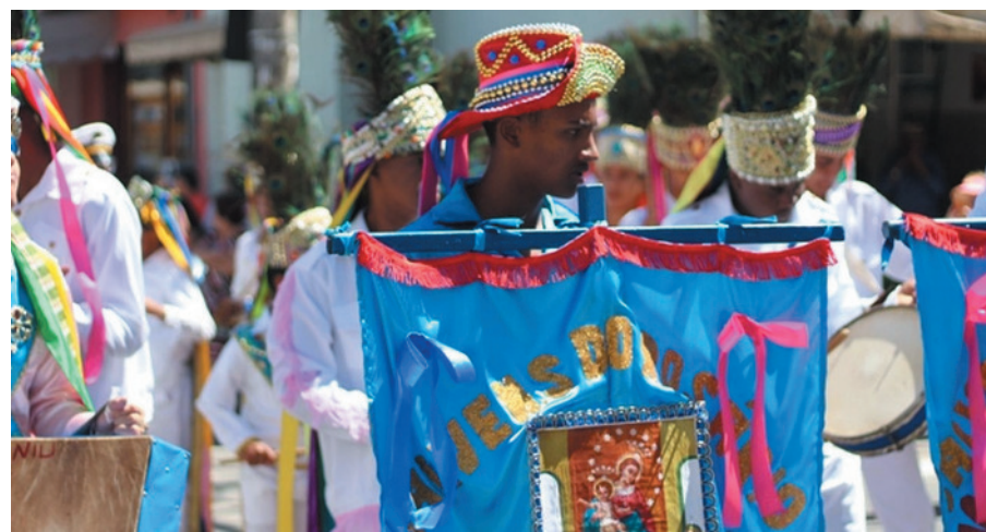
Contagem regressiva para a 181ª Festa de Agosto